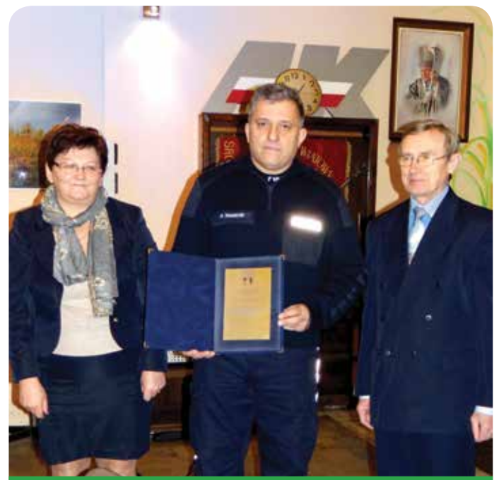
Wójt gminy, Komendant Komendy Powiatowej Policji oraz Przewodniczący Rady

Pełne teksty uchwał oraz wyniki głosowań są dostępne w Biuletynie Informacji Publicznej Urzędu Gminy Jabłonna.