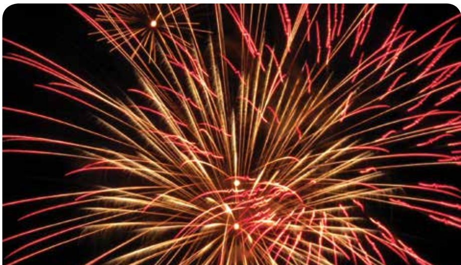
Fajerwerki rozświetliły niebo

Sołtys wsi Chotomów – Artur Oleksiak serdecznie dziękuje sponsorom, wszystkim zaangażowanym w organizację Sylwestra oraz właścicielowi działki, na której bezpiecznie odpalano sztuczne ognie.