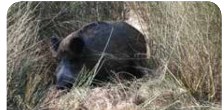
Dziki to duży problem w całym powiecie

Większość działań będzie kontynuowana w 2014 r. Jednak, by żyć bez dzików, potrzebna jest też współpraca ze strony mieszkańców – im mniej jedzenia będziemy wyrzucać, tym mniej dzików skuszonych zapachem odpadków będzie odwiedzało nasze okolice.