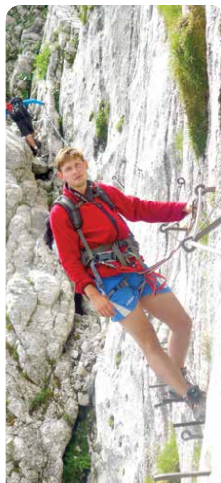
Via ferrata na Zugspitze