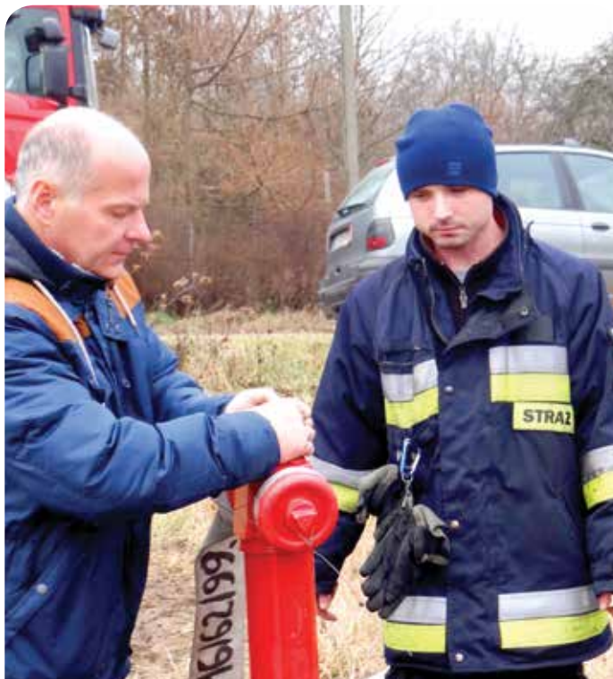
Nowe ujęcie zostało przetestowane przez OSP

Ochotnicze Straże Pożarne z terenu Gminy Jabłonna (OSP Jabłonna i OSP Chotomów) posiadają 5 samochodów ratowniczo-