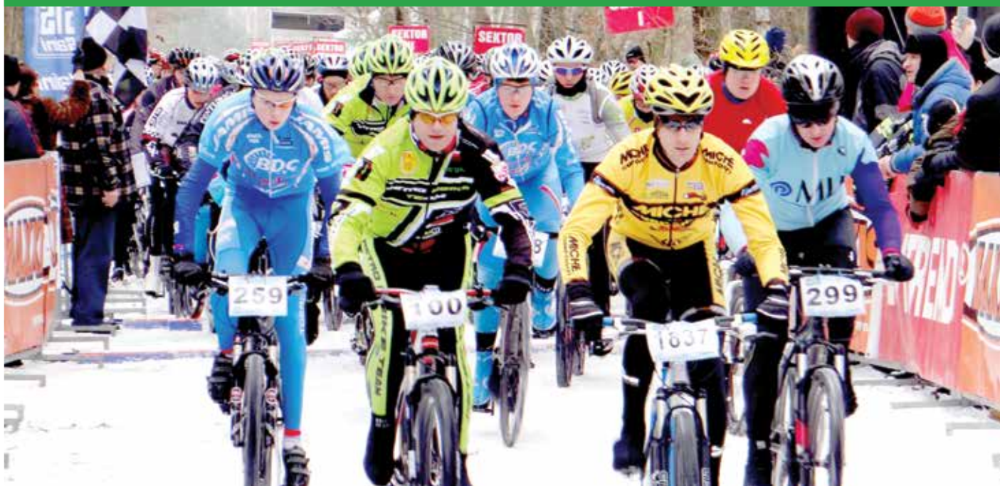
Zimowy maraton rowerowy w Chotomowie