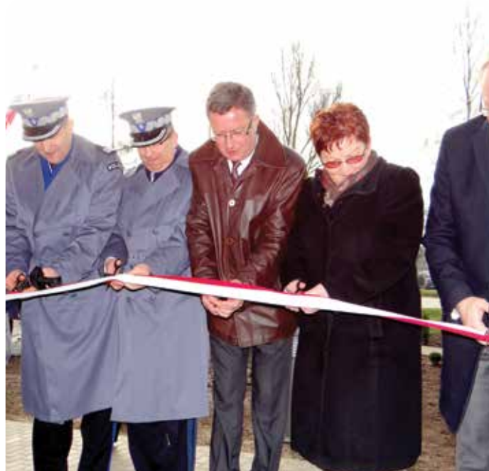
Uroczyste przecięcie wstęgi