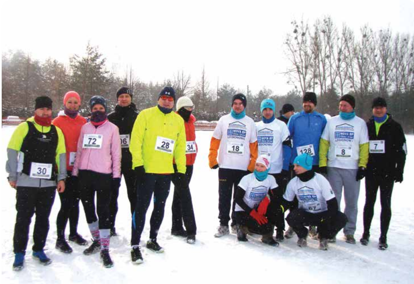
Zimowy start grupy w Wieliszewie