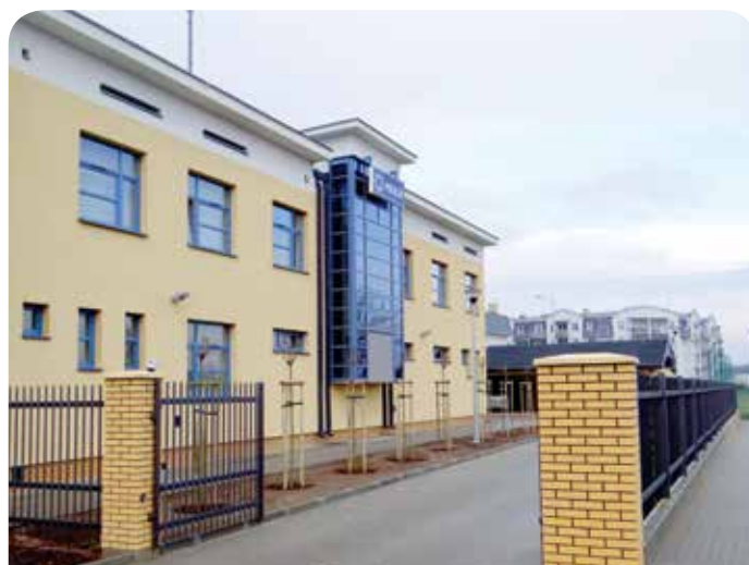
Siedziba mundurowych jest dostosowana do wymogów programu standaryzacji Policji

na której stanął policyjny budynek oraz udzieliła wsparcia finansowego w wysokości 274 170 zł. Pieniądze pozwoliły na opłacenie kosztów dokumentacji przyłącza energetycznego oraz kupno części materiałów budowlanych. W pobliżu komisariatu gmina Jabłonna, za pieniądze pozyskane z Unii Europejskiej – wybudowała parking (16 miejsc dla samochodów – w tym 1 miejsce dla niepełnosprawnych) wraz z chodnikiem (od strony Osiedla Złotej Renety).