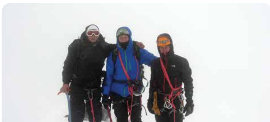
Niestety bez widoków. Na szczycie Mont Blanc