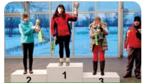
Zwycięzynie biegu kobiet

Inicjatorami stworzenia trasy w gminie Jabłonna byli miłośnicy narciarstwa biegowego z Chotomowa.