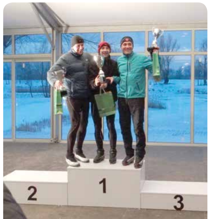
Najszybsi wśród mężczyzn