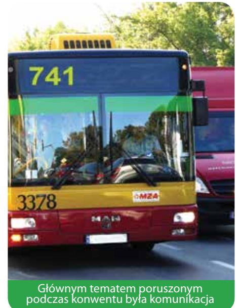
Głównym tematem poruszonym podczas konwentu była komunikacja

Konwent to cykliczne spotkanie samorządowców z terenu powiatu legionowskiego. Na spotkaniach omawiane są najistotniejsze problemy dotyczące samorządów.