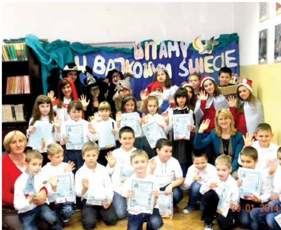
Pierwszoklasiści otrzymali dyplomy, karty biblioteczne oraz słodkie upominki

Biblioteka Szkolna – Szkoła Podstawowa im. Armii Krajowej w Jabłonie.