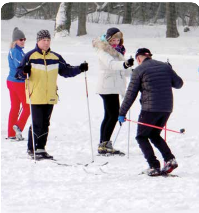
Uczestnicy biegu inaugurującego trasę