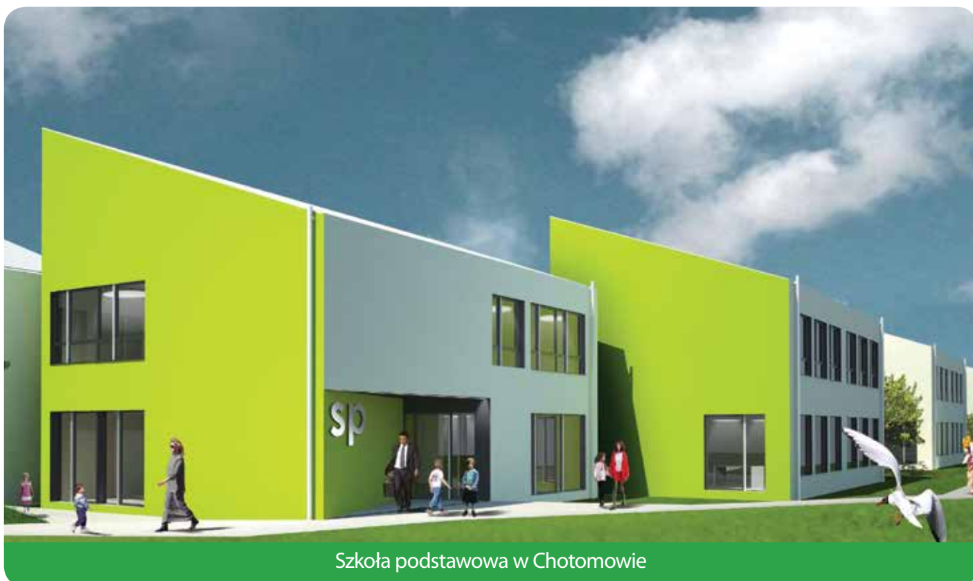
Szkoła podstawowa w Chotomowie

Prognozowane dochody roku 2014 wynoszą 51.543.564 zł, przy planowanych wydatkach na kwotę 55.427.954 zł. Powstała różnica pomiędzy dochodami, a wydatkami stanowi deficyt budżetu gminy na kwotę 3.884.390 zł, który związany jest z realizacją zadań inwestycyjnych w gminie i zostanie pokryty z planowanej emisji obligacji. W 2014 roku spłacane będzie głównie zaciągnięte w latach ubiegłych na preferencyjnych warunkach, zadłużenie gminy w Wojewódzkim Funduszu Ochrony Środowiska i Gospodarki Wodnej jak również w Banku Ochrony Środowiska związane z realizacją zadań inwestycyjnych realizowanych w gminie. Zadłużenie gminy na 31 grudnia 2013 roku