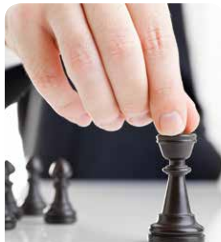
W ramach XVII Grand Prix Gminy Jabłonna zostaną rozegrane cztery turnieje

Trzech pierwszych zawodników w każdej z kategorii dostało pamiątkowe dyplomy. Zwycięzcą XVII Grand Prix Gminy Jabłonna zostanie ta osoba, która zgromadzi jak największą liczbę punktów z czterech rozegranych turniejów szachowych. Regulamin i dokładne wyniki na stronach internetowych www.chessarbiter.com lub www.szachyjablonna.mzszach.pl