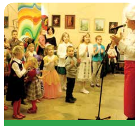
Dzieci chętnie włączały się do zabaw

Najmłodszy z Suchocina, Trzcian, Janówka Drugiego bawili się w Sali BE-FIT w Suchocinie, dzieci ze Skierd, Rajszewa i Jabłony spotkały się w sali GCKiS w Jabłonie. W Chotomowskiej filii GCKiS odbyła się zabawa choinkowa dla dzieci z Chotomowa i Dąbrowy Chotomowskiej, natomiast młodzi mieszkańcy Bożej Woli spotkali się z Mikołajem w Klubie Rolnika.