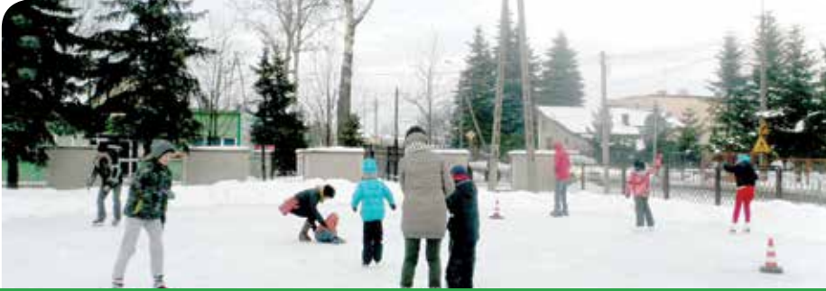
Lodowisko cieszy się dużą popularnością wśród Mieszkańców Chotomowa

Z inicjatywy Ochotniczej Straży Pożarnej w Chotomowie w centrum miejscowości powstało lodowisko.