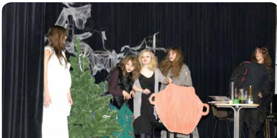
Szekspir w Jabłonie