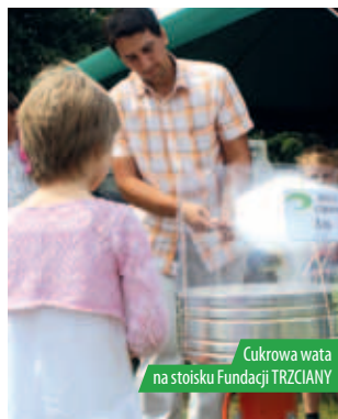
Cukrowa wata na stoisku Fundacji TRZCIANY