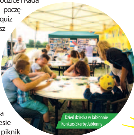
Dzień dziecka w Jabłonie Konkurs Skarby Jabłonne