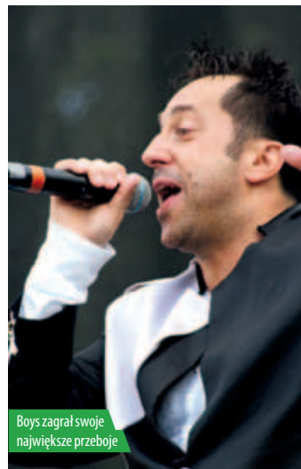
Boys zagrał swoje największe przeboje