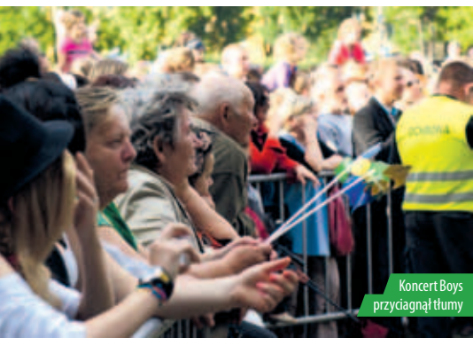
Koncert Boys przyciągnął tłumy