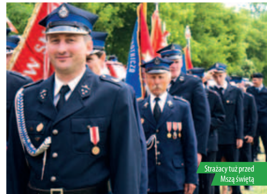
Strażacy tuż przed Mszą świętą