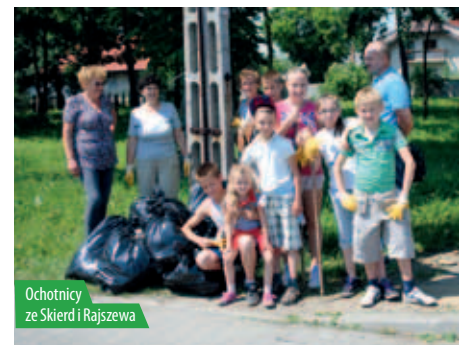
Ochotnicy ze Skierd i Rajszewa

Dbanie o środowisko w którym żyjemy i szacunek dla natury, to jeden z podsta-