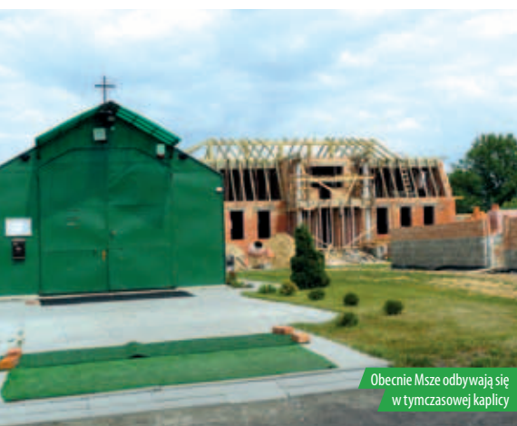
Obecnie Msze odbywają się w tymczasowej kaplicy

P lac pod budowę kościoła został poświęcony w sierpniu zeszłego roku. Nowa parafia powstaje z terenów wydzielonych z parafii Wniebowzięcia Najświętszej Maryi Panny w Chotomowie i Świętych Apostołów Piotra i Pawła w Nowym Dworze Mazowieckim. Kościół pomieści 4 tysiące wiernych.