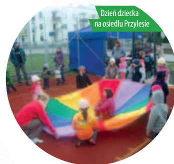
Dzień dziecka na osiedlu Przylesie