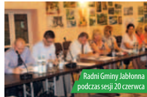
Radni Gminy Jabłonna podczas sesji 20 czerwca