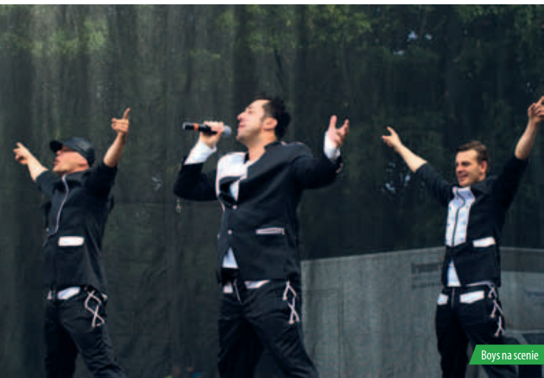
Boys na scenie