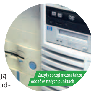
Zużyty sprzęt można także oddać w stałych punktach

Do pojemników należy wrzucać leki w postaci: tabletek i drażetek, ampułek, aerozoli, maści, proszków, syropów, kropli oraz roztworów w szczelnie zamkniętych opakowaniach, pozbawionych tekturowych pudełek.