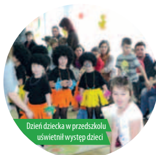
Dzień dziecka w przedszkolu uświetnił występ dzieci