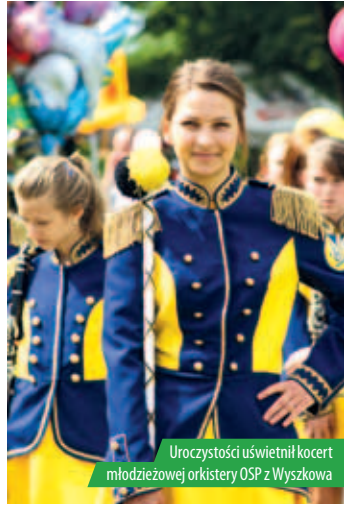
Uroczystości uświetnił koncert młodzieżowej orkiestry OSP z Wyszkowa