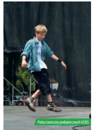
Pokaz taneczny podopiecznych GCKiS