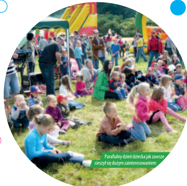
Parafialny dzień dziecka jak zawsze cieszył się dużym zainteresowaniem