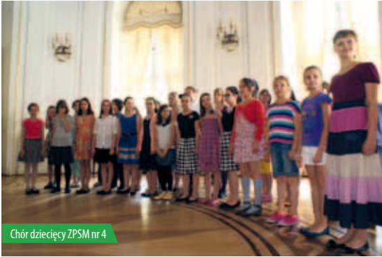
Chór dziecięcy ZPSM nr 4

W niedzielę 17 czerwca w Pałacu PAN w Jabłonce odbył się setny koncert w ramach projektu „Pałacowe spotkania z muzyką”. Jubileusz był okazją do wspomnień i podziękowań dla tych, którzy wspierają cykl.