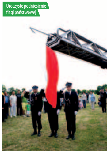
Uroczyste podniesienie flagi państwowej