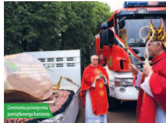
Ceremonia poświęcenia pamiątkowego kamienia