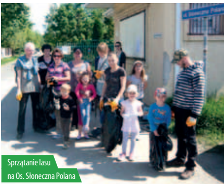
Sprzątanie lasu na Os. Słoneczna Polana

Po raz kolejny mieszkańcy postanowili wziąć sprawy w swoje ręce i zadbać o czystość. Tym razem akcje „Sprzątania Świata” przygotowali mieszkańcy os. Słoneczna Polana w Jabłonie oraz mieszkańcy wsi Rajszew i Skierdy.