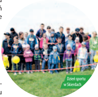
Dzień sportu w Skierdach