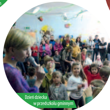
Dzień dziecka w przedszkolu gminnym