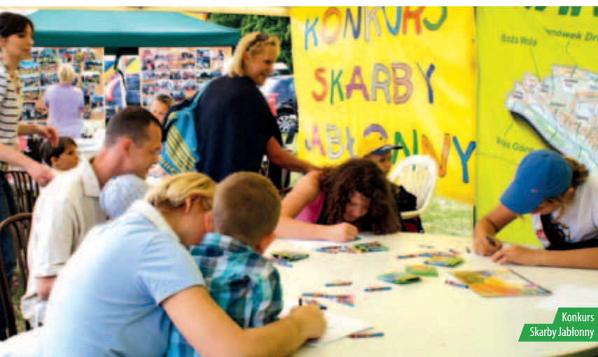
Konkurs Skarby Jabłonna