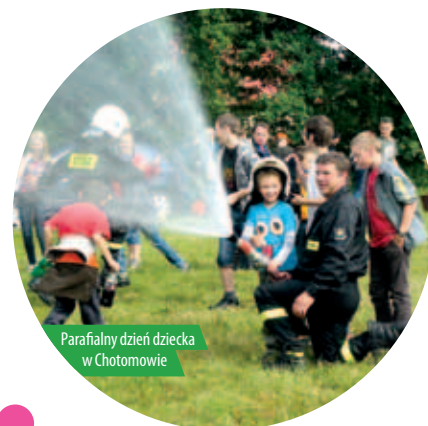
Parafialny dzień dziecka w Chotomowie

Gminne obchody zakończył festyn w Bożej Woli zorganizowany 9 czerwca przez Sołtysa, Radę Sołecką oraz stowarzyszenie Viribus Unitis.