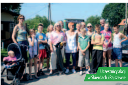
Uczestnicy akcji w Skierdach i Rajszewie

Pełni zapału mieszkańcy Słonecznej Polany, wśród których znalazło się trzynaścioro przedstawicieli najmłodszego pokolenia, przeprowadzili akcję w sobotę 26 maja. Uczestnicy oczyścili okolicę ze śmieci i innych przedmiotów, pozostawiając ją czystą i zadbaną.