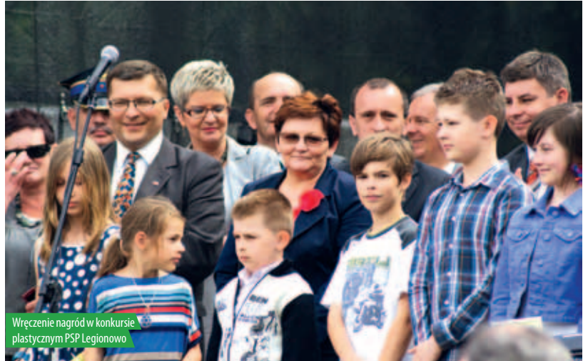
Wręczenie nagród w konkursie plastycznym PSP Legionowo